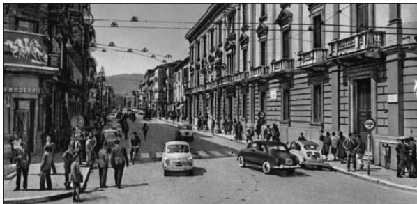
Corso Vittorio Emanuele negli anni Sessanta