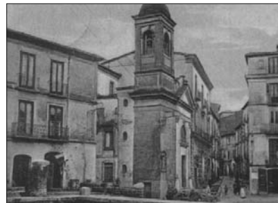
Piazza del popolo

Ad Avellino non c'è mai stata la tradizione di preparare e vendere cibo in strada. L'unica eccezione è rappresentata dai camacottari che con i loro motofurgoni attrezzati, che sostituiscono i vecchi carretti illuminati con lampade ad acetilene, vendono 'o pere e 'o musso e puorco. Ma sono di tradizione e, ancora oggi, di provenienza prettamente napoletana. Nemmeno possiamo considerare cibo di strada i pezzi di baccalà fritto con contorno di peperoni verdi che facevano bella mostra sulla mezza sedia posta all'ingresso delle cantine che si trovavano sul Carmine. Quel croccante alimento serviva principalmente per dare visibilità al locale ma la consumazione avveniva all'interno dell'osteria. Quanto li ho desiderati quando accompagnavo nonna per la spesa giornaliera a Piazza del Popolo. Niente da fare, l'unica