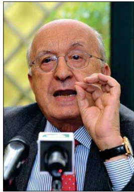
Ciriaco De Mita

AVELLINO - Lunedì gli amministratori dei Comuni irpini e sanniti dovranno eleggere i 30 componenti del consiglio di distretto dell'Ente idrico campano. È un appuntamento di notevole importanza anche per il futuro dell'Ente idrico Alto Calore. I partiti di centro-destra e quelli di centro-sinistra hanno tentato un'intesa istituzionale, capace di portare ad un'unica lista di candidati. Ma l'accordo non è stato raggiunto e così centrodestra e centrosinistra si presenteranno a questo appuntamento con due liste contrapposte. L'Udc di Ciriaco De Mita, cui fa da spalla il sindaco di Benevento Clemente Mastella, è schierato con il centrodestra, quindi in contrapposizione al Pd, come accade pure al Comune di Avellino e all'amministrazione provinciale, ma non alla Regione Campania, dove i consiglieri Udc sostengono il