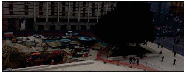
Il cantiere di Piazza Libertà

AVELLINO - Il cantiere di Piazza della Libertà, opera pubblica da 5 milioni di euro inserita nel Programma integrato urbano «Piu Europa» finanziata con i fondi comunitari, finisce sotto la lente di ingrandimento della Corte dei conti europea. Lo scorso martedì, alcuni delegati dell'organo di verifica contabile con sede in Lussemburgo hanno fatto tappa ad Avellino per verificare le procedure messe in atto per la riqualificazione della principale agorà del capoluogo irpino. Piazza della Libertà è stata selezionata, al pari di altre quattro opere inserite nei Programmi integrati urbani di altrettante «città medie» destinatarie del finanziamento europeo, come cartina di tornasole dai revisori della Corte dei conti europea, per un'indagine amministrativo-contabile che dovrà scandagliare tutto l'iter procedurale partendo dall'accordo di programma, primo atto ufficiale sottoscritto tra il Comune di Avellino e la Regione Campania e