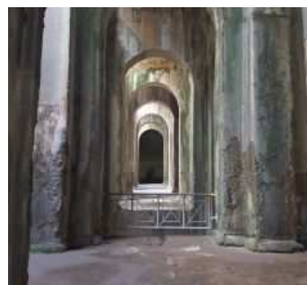
La piscina mirabilis di Miseno